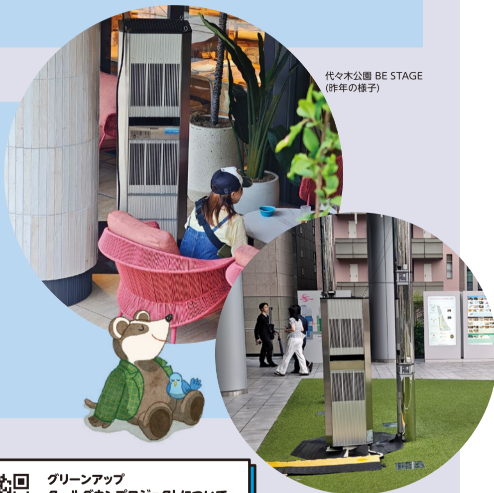
代々木公園 BE STAGE (昨年の様子)

外でエアコンの涼しさを感じられるなんて、暑い日にはとっても助かるよね。このクールダウンプロジェクトは今年も計画されているよ!ぜひ立ち寄って、涼しくすごしてね。