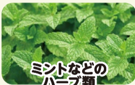
ミントなどの ハーブ類